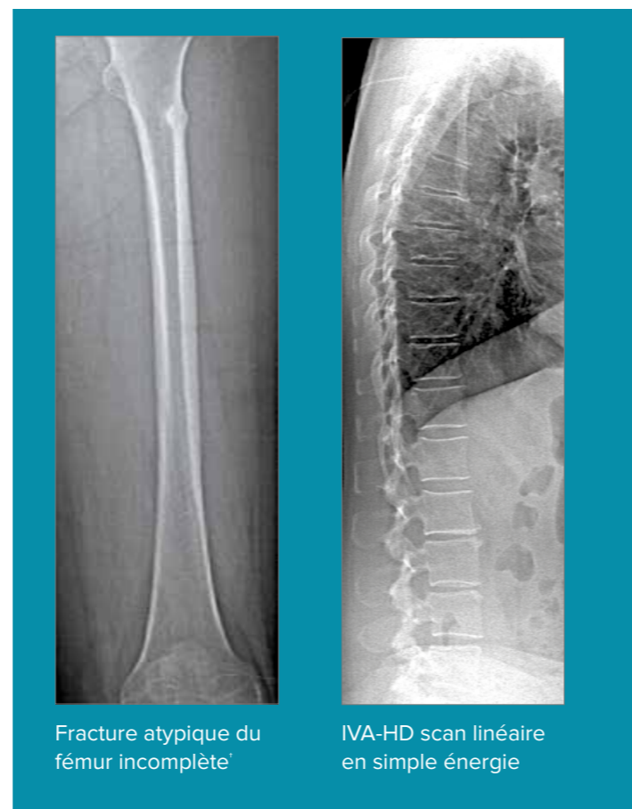
Fracture atypique du fémur incomplète †

Le système Horizon DXA permet de générer des images radiographiques de toute la zone fémorale afin d'évaluer les éventuelles fractures atypiques du fémur. Une exploration en 20 secondes révèle l'épaississement cortical, ce qui permet un contrôle des effets du traitement par bisphosphonate dans le temps.