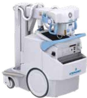
OMNISCOP DREAM-S Arceau chirurgical