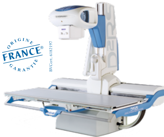
D 2 RS Imagerie Dynamique