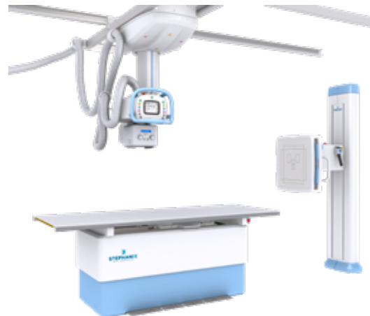
XTREME Salle Os-Poumons